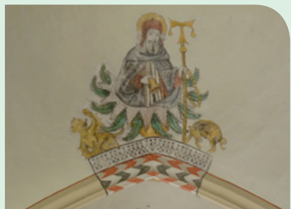
Sint Antonius Abt

St. Antonius Abt heeft ook een bijzondere plaats in de Onze Lieve Vrouwebasiliek. Hij is een van de vele pestheiligen die aangeroepen werden als de pest heerste. Hij wordt altijd afgebeeld met een varken en een bel (klok). Hier is hij afgebeeld op een gewelfschildering in de Broerenkerk. 🏰