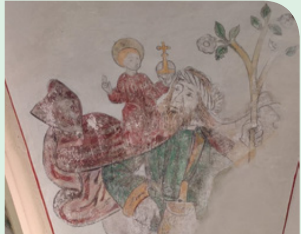
Sint Christoffel, gewelfschildering in de 15e-eeuwse Broerenkerk in Zwolle

de legendarische veerman Christoforus die het Christuskind op zijn schouder naar de overkant van de rivier bracht. Het opschrift op de klok luidt: 'Het klokkenspel waarvan ik deel uitmaak, klonk voor het eerst over Zwolle op den dag der openstelling van de (IJssel)brug.'