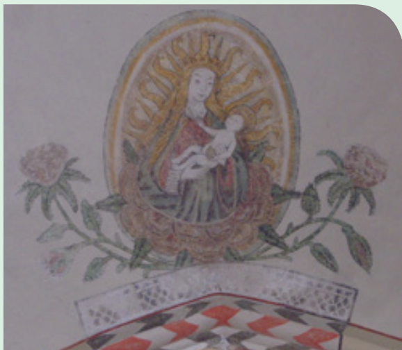
Onze Lieve Vrouwe

De Onze Lieve Vrouwebasiliek, waar de toren bij hoort, is gewijd aan Maria. Hier is zij afgebeeld op een gewelfschildering in de 15e-eeuwse Broerenkerk in Zwolle, thans boekhandel Waanders in de Broeren.